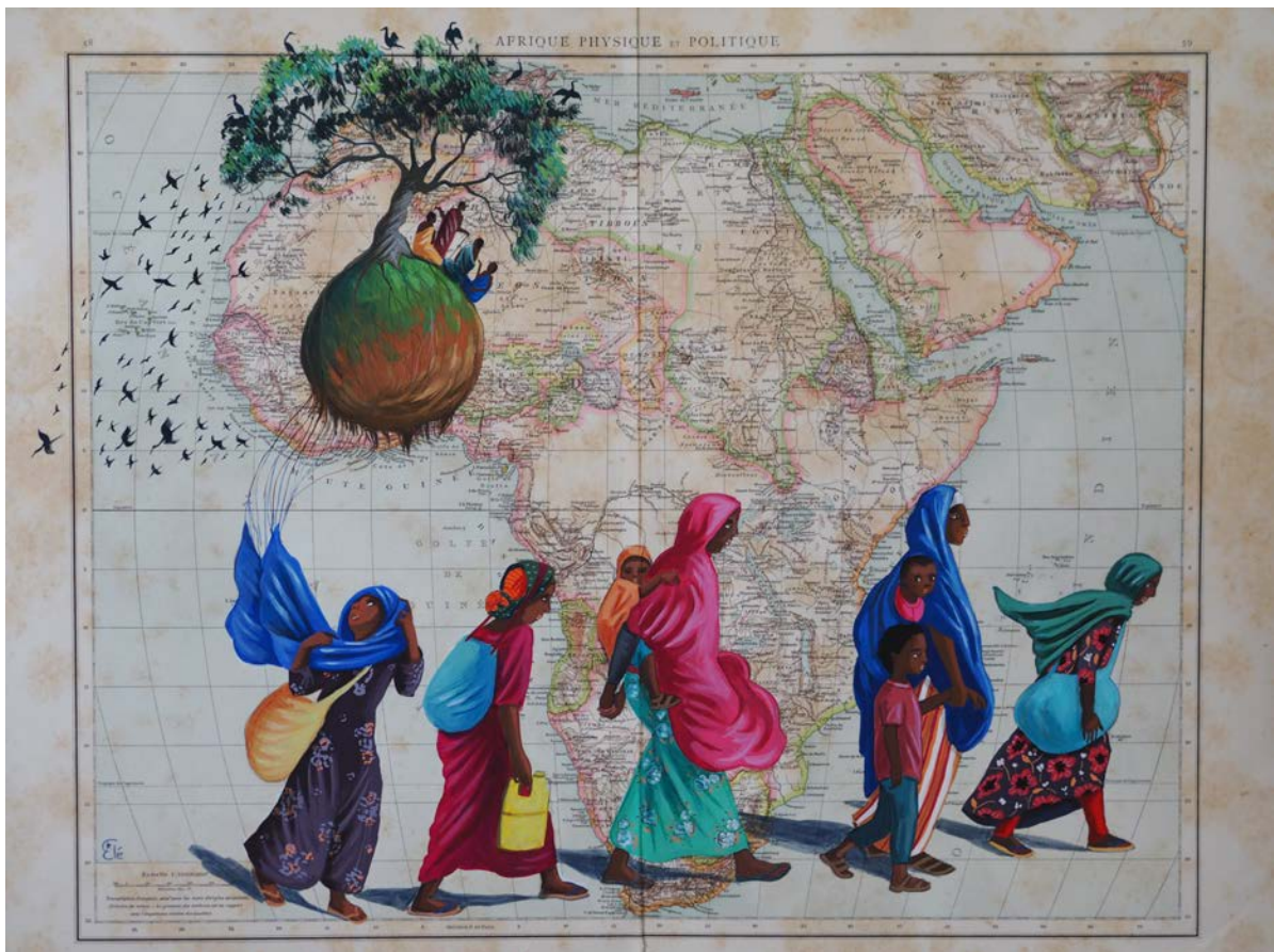
Exode, gouache et papiers découpés sur carte ancienne