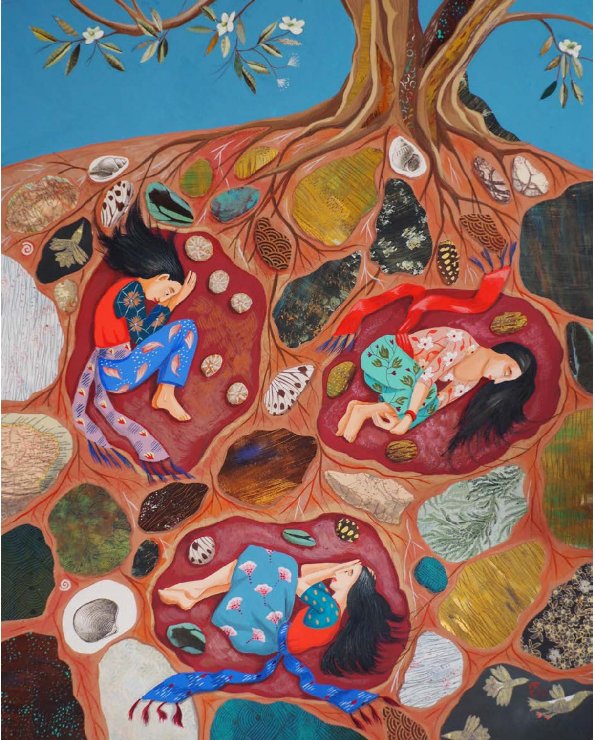
Sœurs, gouache et papiers découpés